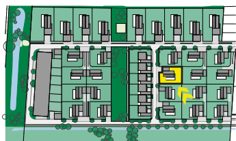
Schéma půdorysu představuje řešení domu pro marketingové účely a mají pouze informativní charakter. Názvy, popisy, kóty a plošné výměry jsou pouze orientační. Vyobrazená zařízení (nábytek, kuchyňská linka, elektrické spotřebiče atd.) nejsou součástí dodávky. Přesný rozsah dodávky a ploch je specifikován ve smlouvě. Developer se tímto nevzdává práva na případné změny, úpravy či doplnění tohoto marketingového materiálu.