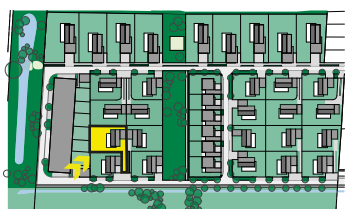
Schéma půdorysu představuje řešení domu pro marketingové účely a mají pouze informativní charakter. Názvy, popisy, kóty a plošné výměry jsou pouze orientační. Vyobrazená zařízení (nábytek, kuchyňská linka, elektrické spotřebiče atd.) nejsou součástí dodávky. Přesný rozsah dodávky a ploch je specifikován ve smlouvě. Developer se tímto nevzdává práva na případné změny, úpravy či doplnění tohoto marketingového materiálu.