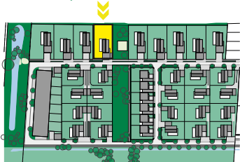
Schéma půdorysu představuje řešení domu pro marketingové účely a mají pouze informativní charakter. Názvy, popisy, kóty a plošné výměry jsou pouze orientační. Vyobrazená zařízení (nábytek, kuchyňská linka, elektrické spotřebiče atd.) nejsou součástí dodávky. Přesný rozsah dodávky a ploch je specifikován ve smlouvě. Developer se tímto nevzdává práva na případné změny, úpravy či doplnění tohoto marketingového materiálu.